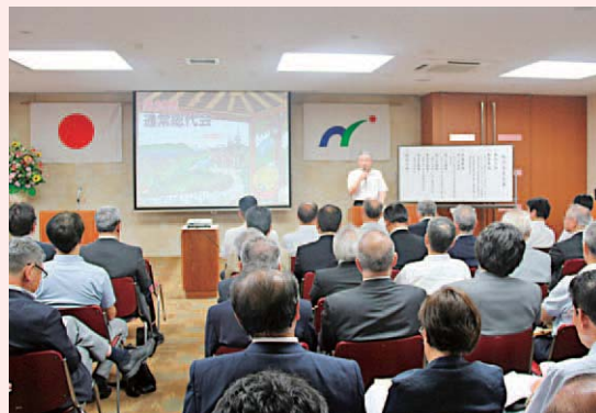
通常総代会(平成26年6月18日)