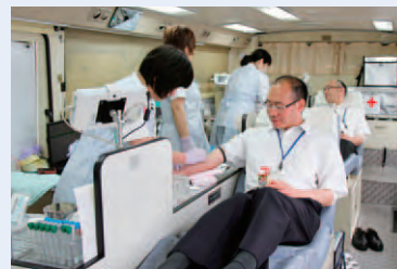
信用金庫の日(献血)