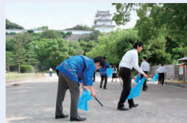
信用金庫の日(清掃)