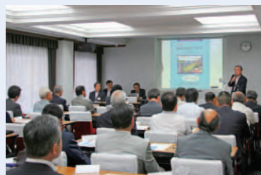
地区総代懇談会(神戸地区)