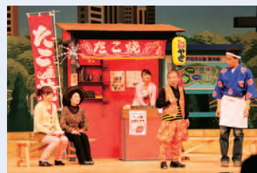
新春吉本バラエティーショーご優待