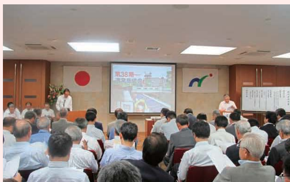
通常総代会(平成25年6月19日)