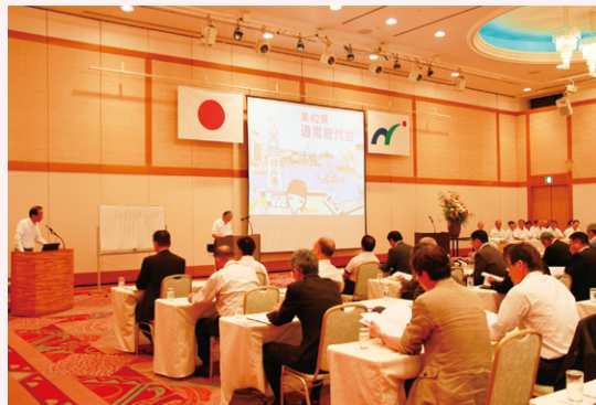
通常総代会(平成29年6月19日)