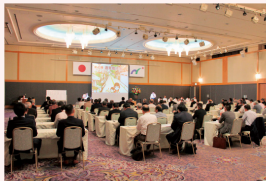
通常総代会(平成30年6月18日)