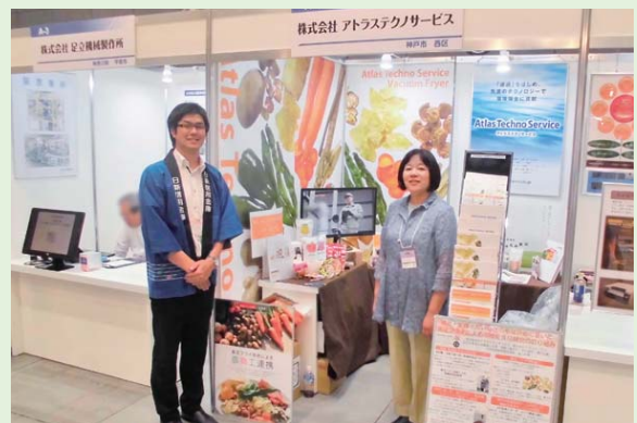
■ 2018 “よい仕事おこし” フェア