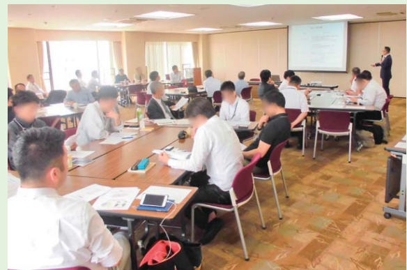
■ 経営に役立つセミナー