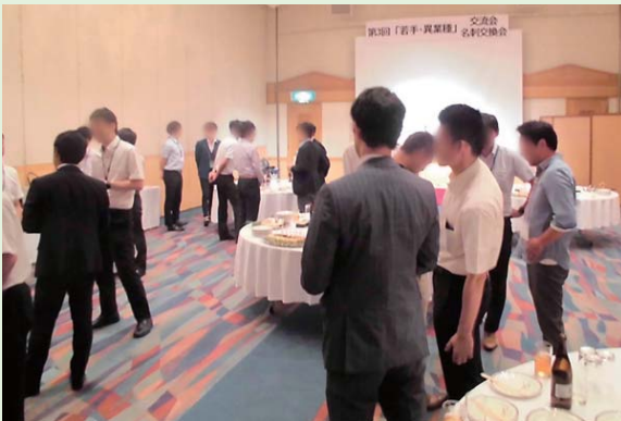
■ 「若手・異業種」交流会/名刺交換会

注1)「資格取得者数」は、中小企業診断士、1級ファイナンシャル・プランニング技能士及び2級ファイナンシャル・プランニング技能士(中小事業主資産相談業務)の取得者数。