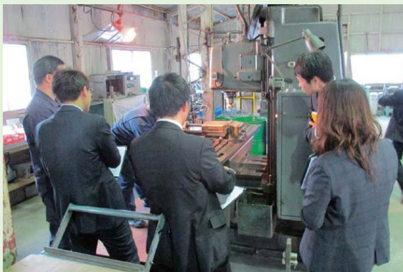
■ 製造業の現場診断とカイゼン提言研修