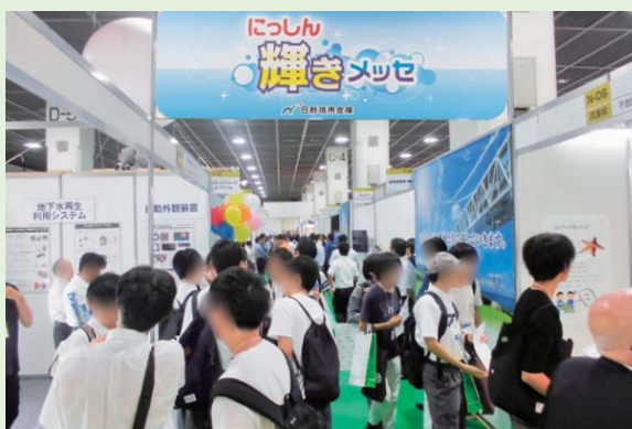
■ 〈にっしん〉輝きメッセ2018