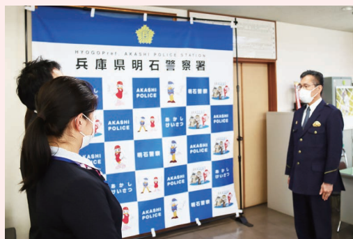
江井ヶ島支店、西明石支店 (明石警察署 2023年3月)